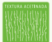
Linhas Atrative e Ambience